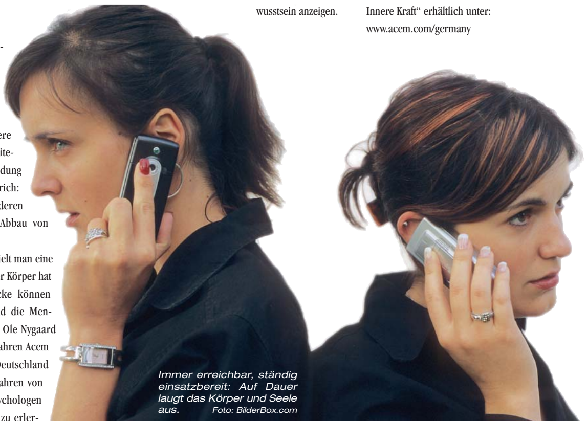
Immer erreichbar, ständig einsatzbereit: Auf Dauer laugt das Körper und Seele aus.

► Lesetipp: Are Holen, Ole Nygaard „Acem-Meditation, Entspannung, Stille, Innere Kraft“ erhältlich unter: www.acem.com/germany